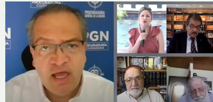
Audiencia PGN Bahía de Cartagena