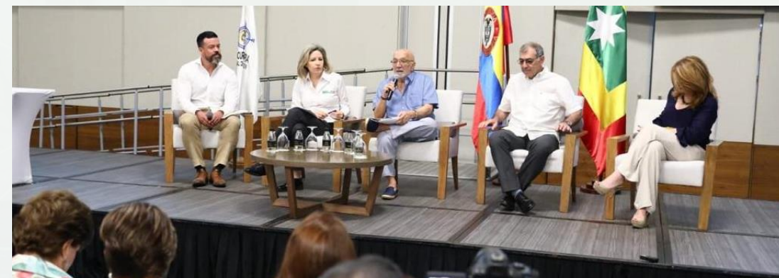
Audiencia de contratación pública, PGN