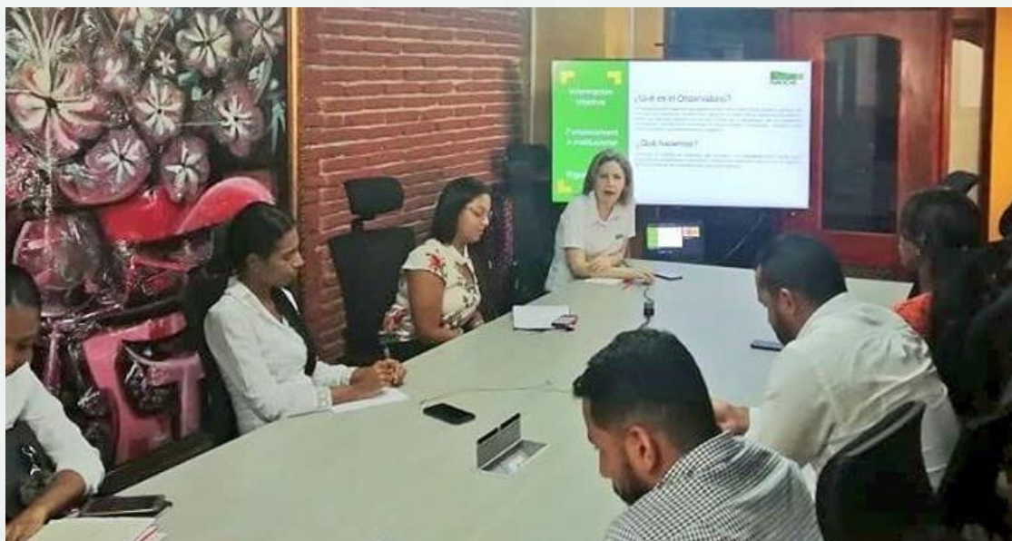
Recomendaciones mesa directiva del Concejo