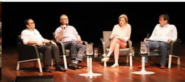
Gran Encuentro Ciudadano, Alcaldía de Cartagena